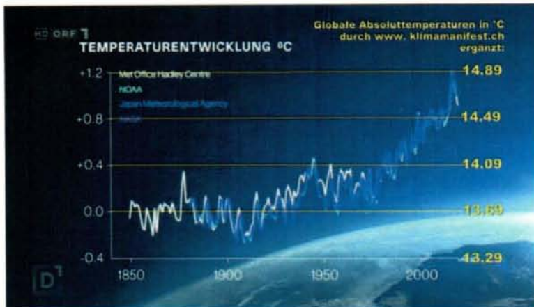
Abbildung 2: Ausschnitt aus der ORF-Version des Films «Der Klimawandel. Die Fakten» vom 12.09.2019 mit Ergänzung der absoluten Temperaturen. Dadurch ist für jeden Zuschauer nachvollziehbar, dass seit 1850 der Temperaturwert von 15 °C aus dem natürlichen Treibhauseffekt überhaupt nicht überschritten worden ist und somit seit 1850 keine gefährliche Erderwärmung existiert.

Diese Film-Sequenz mit der Grafik aus Abbildung 1, die bei BBC, ORF und ZDF gezeigt wurde, wurde von der SRF-Redaktion bei der Ausstrahlung am 14.11.2019 ersatzlos entfernt, angeblich wegen kürzeren Sendeslots.