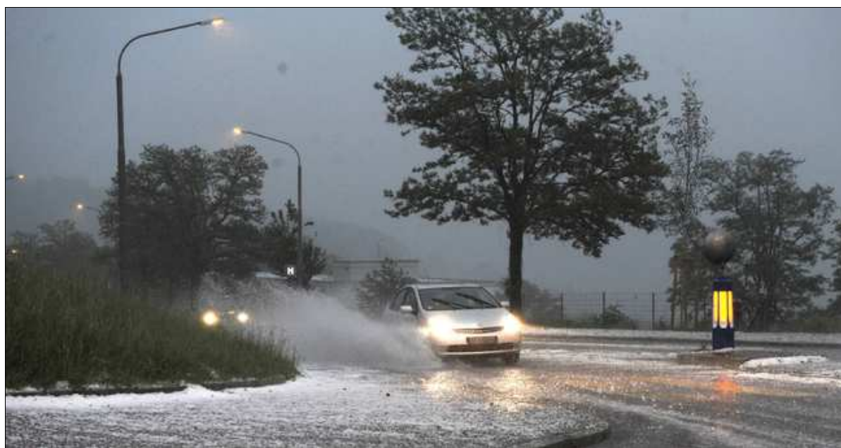
Hagelstürme verursachen auch in Deutschland immer mehr Schäden.

In vielen Teilen der Erde steigen die Temperaturen. Naturkatastrophen nehmen zu und verursachen enorme Kosten. Die Bundesregierung nimmt diese Risiken sehr ernst. Auf dem G7 -Gipfel wird sich Bundeskanzlerin Merkel deshalb besonders für den Klimaschutz einsetzen.